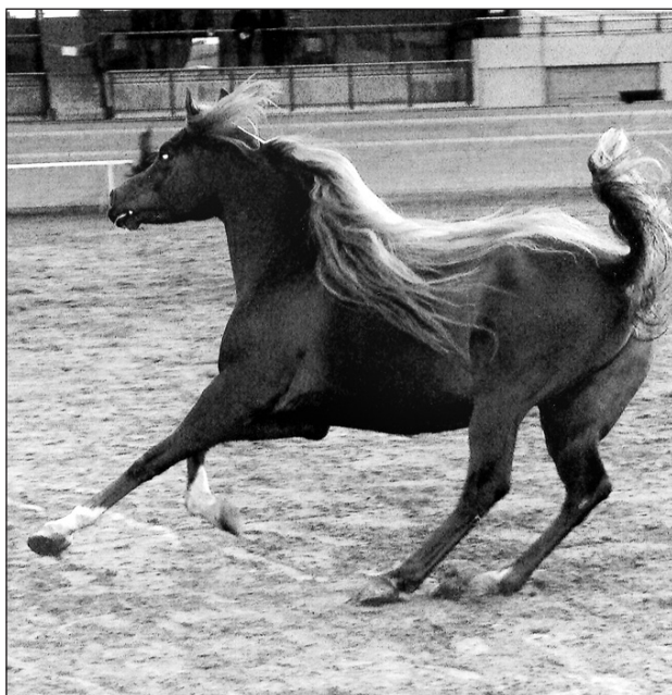
Narziss von Manuela Frehner, Schönholzerswilen.

Selbst wenn die züchterische Beurteilung der Eigenleistung immer mit ge-